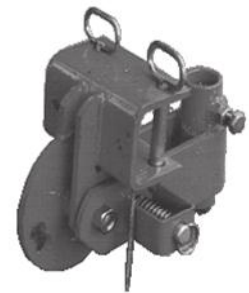
畦立器回転式 取付金具