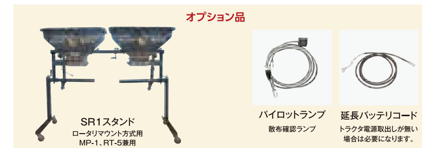
SR1スタンド ロータリマウント方式用 MP-1、RT-5兼用