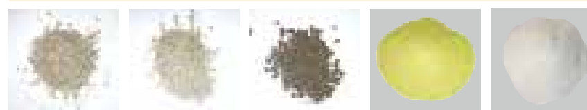
化成肥料、粒状石灰 (1mm~3mm) 苦土石灰 (2mm~4mm) 有機ペレットなど 微粒剤 (ネビリュウ) 微粒剤 (バスアミド) B仕様の場合